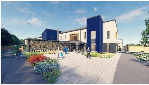
Ysgol newydd Y Garnedd fydd yn agor ym Medi 2020

Pwrpas yr Uned yw datblygu adeiladau newydd neu addasu ac adnewyddu adeiladau presennol i wella'r gwasanaeth a roddir i drigolion Gwynedd.