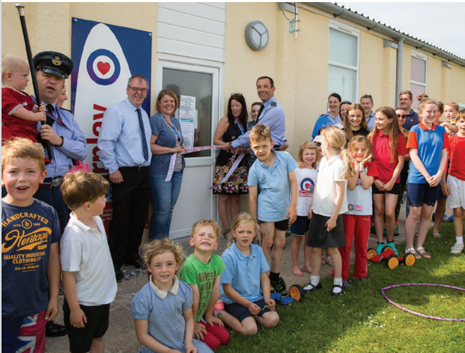
Agoriad swyddogol yr adeiladau cymunedol a adnewyddwyd yn nyffryn yr RAF gyda phlant ysgol lleol.

Yn RAF Y Fali ar Ynys Môn, mae dau swyddog o'r RAF yn eistedd ar fwrdd y Llywodraethwyr yn Ysgol y Tywyn – un o ysgolion cynradd lleol yr orsaf. Mae hyn yn helpu i adeiladu ar y cysylltiadau cryf rhwng y gymuned Gwasanaeth a'r ysgol leol. Mae disgyblion o'r ysgol leol hefyd yn ymweld â'r orsaf yn rheolaidd ac yn defnyddio'r gampfa ar gyfer gweithgareddau chwaraeon, gan ganiatáu i blant brofi'r cyfleusterau sy'n cael eu cynnig a hwyluso'r integreiddio rhwng y Lluoedd Arfog a'r boblogaeth leol. Mae'r orsaf hefyd yn trefnu digwyddiadau i'r teulu trwy gydol y flwyddyn, gan helpu teuluoedd i gwrdd, ymgysylltu a mwynhau. Yn eu plith y mae digwyddiad diwrnod i'r teulu blynyddol, digwyddiadau parti Calan Gaeaf a Nadolig y plant yr orsaf, ynghyd â digwyddiadau thema mewn nifer o leoliadau ar draws yr orsaf.