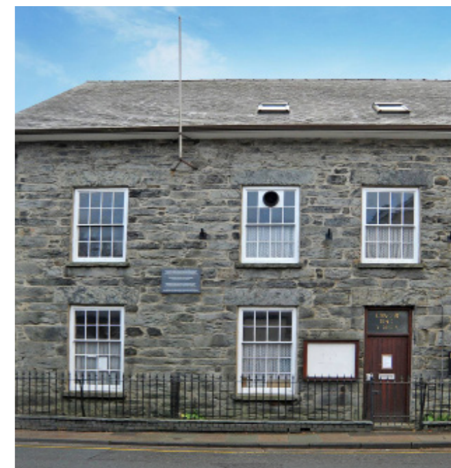
Canolfan Henblas ar Stryd Fawr y Bala

Mae'r cwmni'n gweithio mewn partneriaeth â sefydliadau fel y rhai hynny ym maes gwasanaethau iechyd a lles, ac mae mwy na 15 o sefydliadau wedi dangos diddordeb mewn defnyddio'r adnoddau sydd ar gael yn y ganolfan ar sail achlysurol.